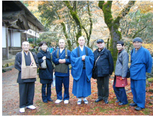
高源寺の和尚様（中央）と一緒に

遠距離だったこともあり参加者少数でした。今年は一泊二日帰りで静岡県浜松市の大本山方広寺（十五年に一度の半僧坊御開帳）参拝を予定しております。