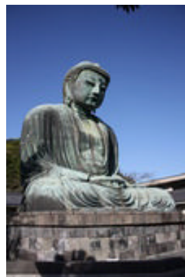
鎌倉大仏（阿弥陀如来）

極楽浄土にいらっしやる仏様。別名「無量寿仏」とも言い、字の如く寿命の量が無い仏様、つまり永遠の命を持った仏様です。人間はせいぜい百年の寿命。永遠の命つてなると一気に非現実的な気がしてしまいますが、身近なところにも永遠に尽きない大きな命があります。この大宇宙です。私たち人間もその大きな命、大宇宙のひとつかけら。そんな永久なる大宇宙を偶像化したのが阿弥陀如来です。崇拝する信者は、必ず極楽浄土（大いなる命）に往生します。