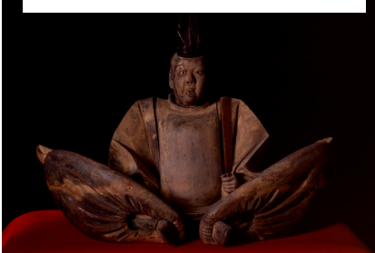
建長寺蔵 北条時頼坐像（重文）

雨は大地を潤し、やさしさは人の心を潤します。物やお金で繋がった便利な世の中、確かにそんな一面もありますが、それ以上にもっと大切な、見返りを求めないおもてなしの心を持って、人と人のやさしさで繋がった世の中にしていきたいものです。それこそが、760年前に時頼公が禅を取り入れ建長寺を建立した目的、そして思い描いていた理想の国家なのではないでしょうか。